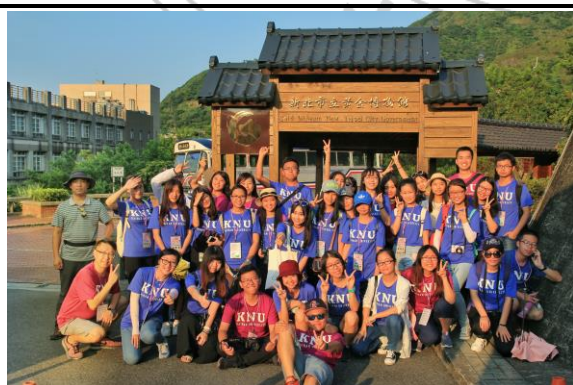
台湾在地文化体验课程