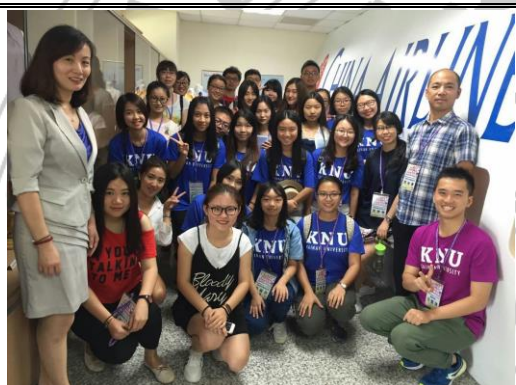
在机舱教室进行讲座课程实作