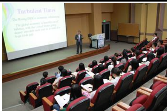
在国际会议厅聆听讲座课程