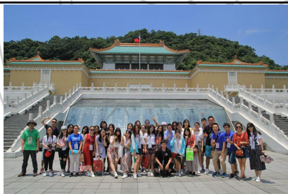
历史文化体验课程