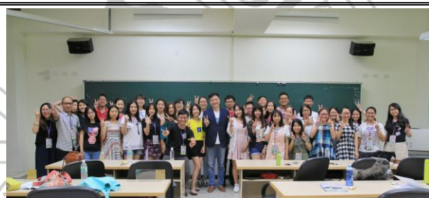
超完美人际沟通讲座课程