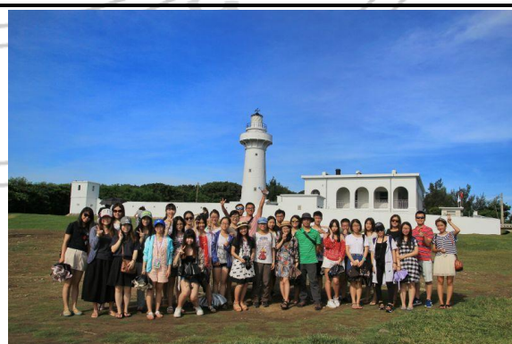
南台湾海洋生态文化体验课程