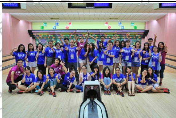
体育竞赛体验课程