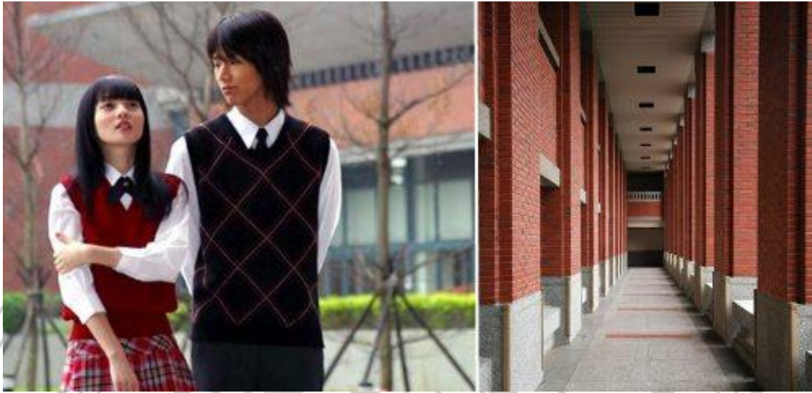
《流星花园》 1 、《爱杀17》 2 、等偶像剧到此拍摄