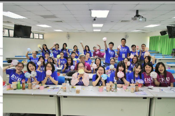
疗愈园艺治疗师讲座课程