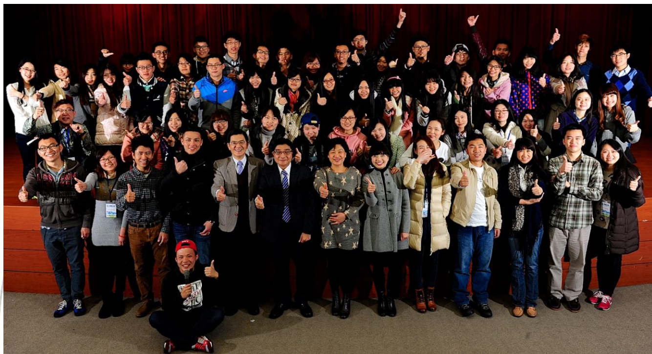
开南大学 2015 陆生 夏令营 (2015.8.15 于行政楼 N407 会议室)