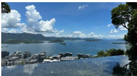
参访交流：香港中文大学