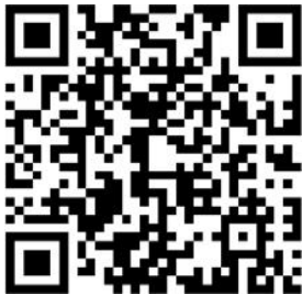
过往学姐学感想和照片素材，可扫码观看

报名条件：适合专业和年级不限；英语最低要求（满足一项即可）：托福76，雅思6，四级450，六级430，高考英语110分，多邻国95；无语言成绩者可面试，面试通过替代语言成绩。（申请人数多，签证慢，无护照者需尽快着手准备护照）