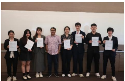
颁发优秀学员证明