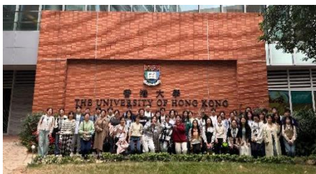
参访交流：香港大学