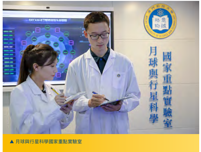
▲ 月球與行星科學國家重點實驗室