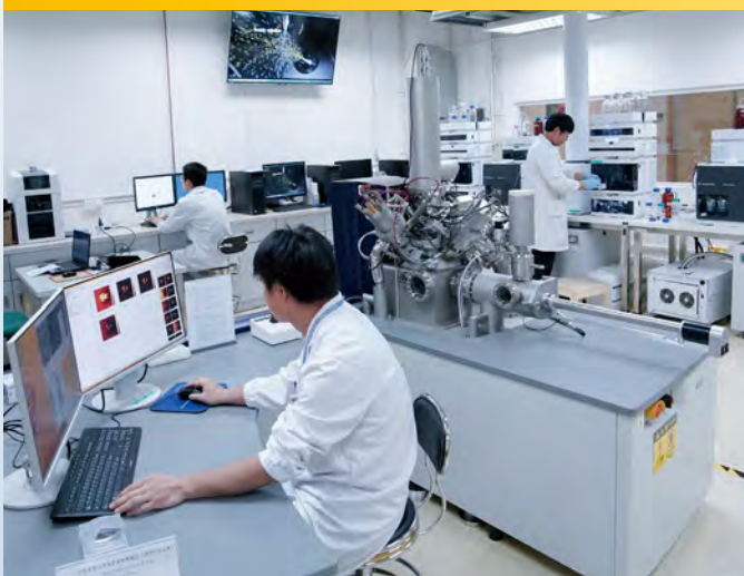
▼ 中藥質量研究國家重點實驗室

大學也特別注重發展特色與優勢研究領域、推動科研成果轉化，如中藥質量與創新藥物、月球與行星科學、癌症與風濕病治療、系統工程、環境科學、智慧城市、建築與城市規劃、人力資源與博彩旅遊管理、澳門歷史、澳門社會文化與可持續發展研究、海峽兩岸暨港澳地區區域法律比較、藝術設計、傳播、知識產權保護、海洋保護與開發利用、下一代互聯網、智能機器人技術創新、數學、澳門知識產權服務等，為地區的持續發展和經濟適度多元發展做出貢獻。