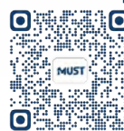
博士課程學習計劃

註：1. 各課程的簡介及學習計劃詳情，請查閱大學網站學院 / 研究所之介紹。 2. 倘課程 / 專業修讀人數不足，大學可決定取消開辦該課程 / 專業。