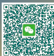
澳科大微信公眾號