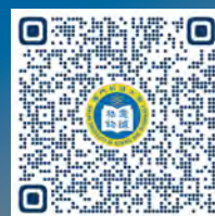
研究生入學申請專頁